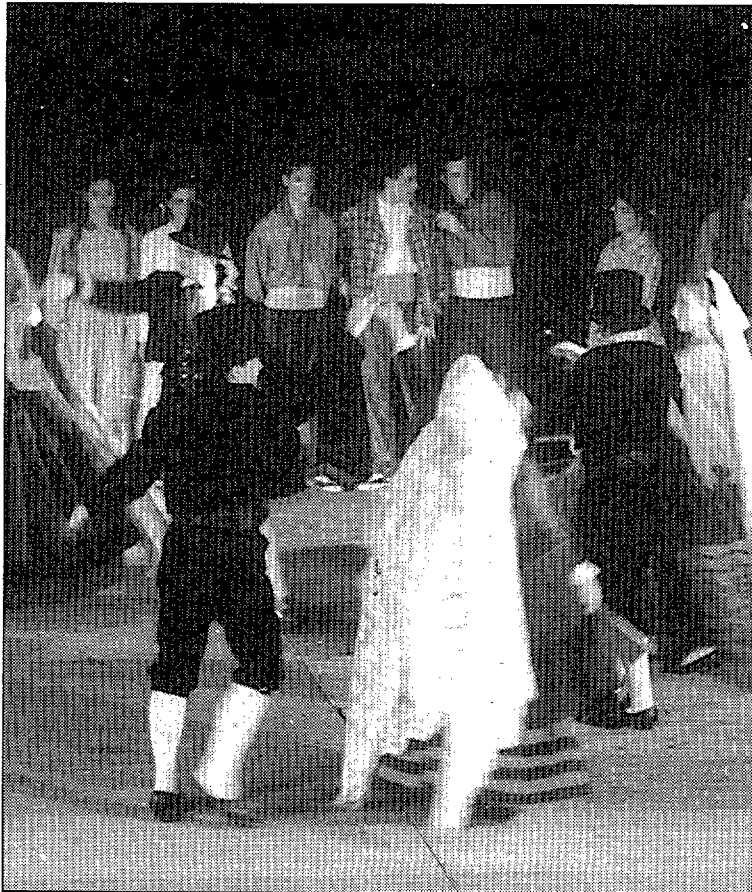
■ L'Esbart Dansaire Santvicentí va obrir el cicle de dansa popular de L'Espai

La darrera peça que van interpretar a L'Espai va ser Festes de Nostra Senyora , inspirada en les Festes del Roser i en totes les celebracions que l'envolten. Els prop de cinquanta dansaires de l'esbart santvicentí van dur a terme un programa d'una durada