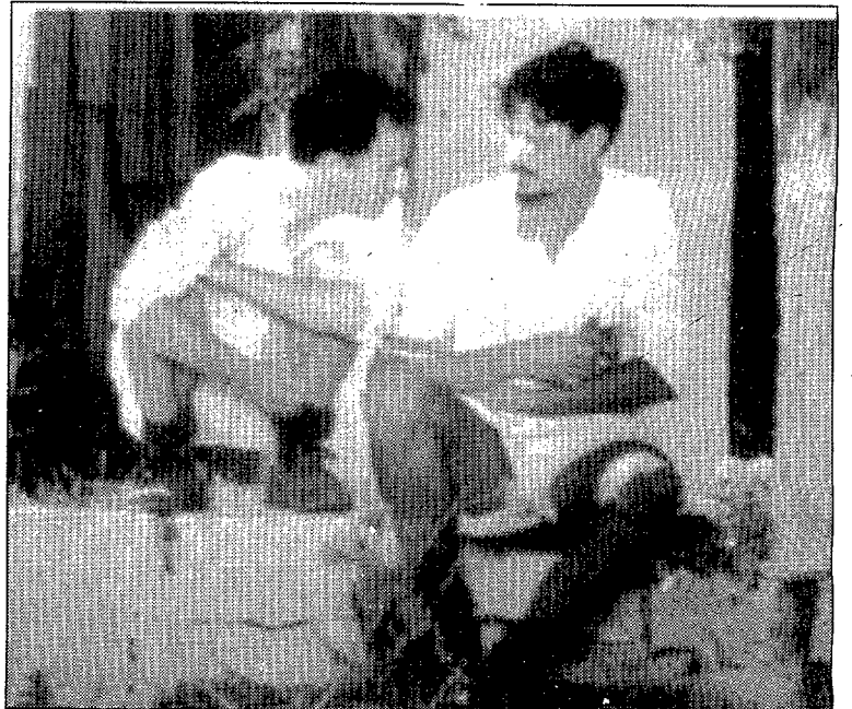
■ «Mediterráneo», un film de Gabriele Salvatore

Fins dijous, 16.30-18.30-20.30-22.30 h. Dimarts, dia de l'espectador