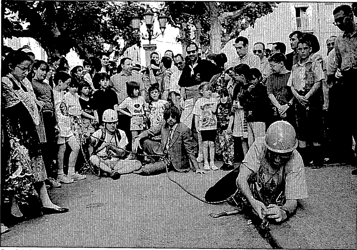
Pregó de Sant Vicenç. El grup teatral Cul-i-seu va convertir els carrers més cèntrics en un gran teatre