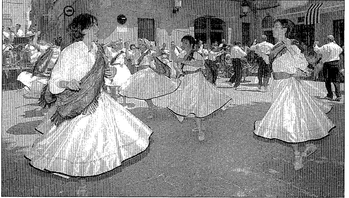
Ball de gitanes de la Festa Major de Sant Vicenç. Amb el canvi de data el consistori pretén fer més actes a l'aire lliure

vien mostrat clarament en contra de la variació de data, «sobretot per interessos comercials», i va afegir-hi que «finalment es va decidir fer una remodelació de la comissió de festes i que fos aquesta qui decidís si se'n canviava o no la data, amb el posterior consentiment del ple».