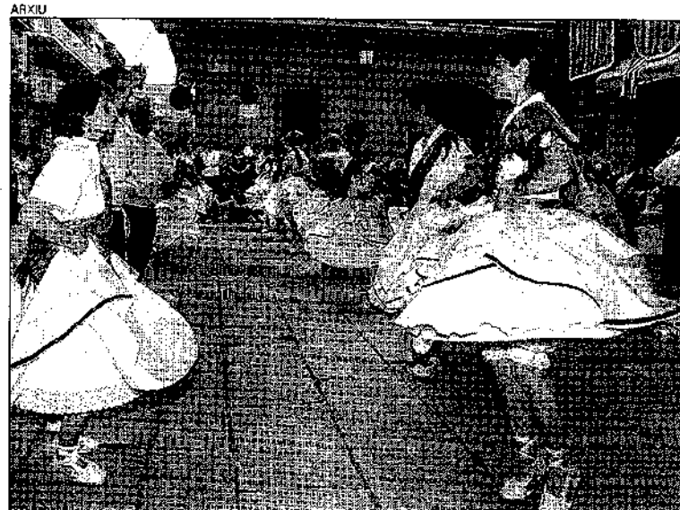
Ball de gitanes de l'any passat. Es fa a la plaça de l'Ajuntament

plaça, primer amb el passeig d'entrada que executa el grup d'antics dansaires, i després amb el galop que fan totes les parelles. A partir d'aquí, s'aniran desenvolupant les diferents peces que componen el ball de gitanes. La festa es clourà amb el vals de Castellet dels gegants santvicentins i el tradicional galop final, en què es convida el públic assistent a participar-hi.