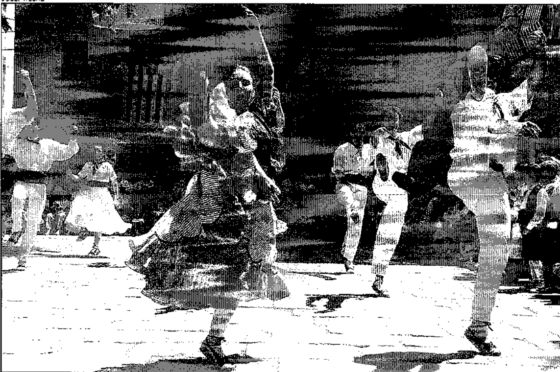
Els dansaires anaven engalanats com marca la tradició. El ball té el seu origen a principi de segle