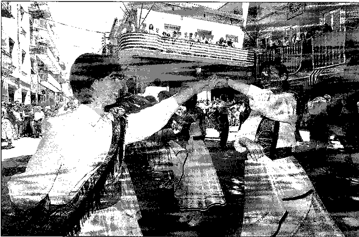
Un moment del ball, a la plaça de l'Ajuntament. Hi van participar una setantena de parelles