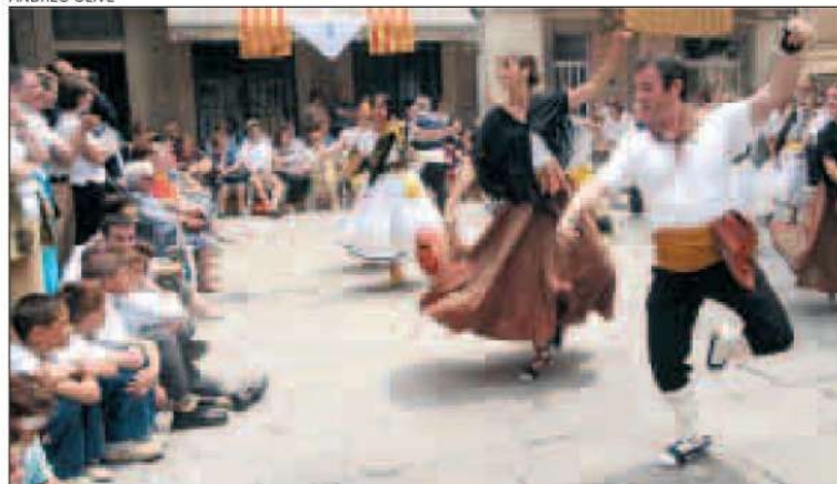
Les colles de dansaries, en plena acció. Hi van participar 170 balladors