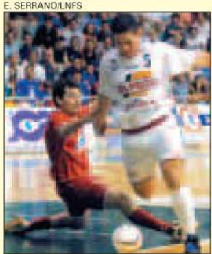
Partit El Pozo-Miró, ahir