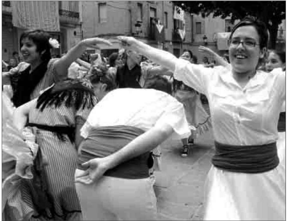
Ballada de gitanes. Les evolucions de 170 balladors van ser seguides pel públic situat al voltant de la plaça