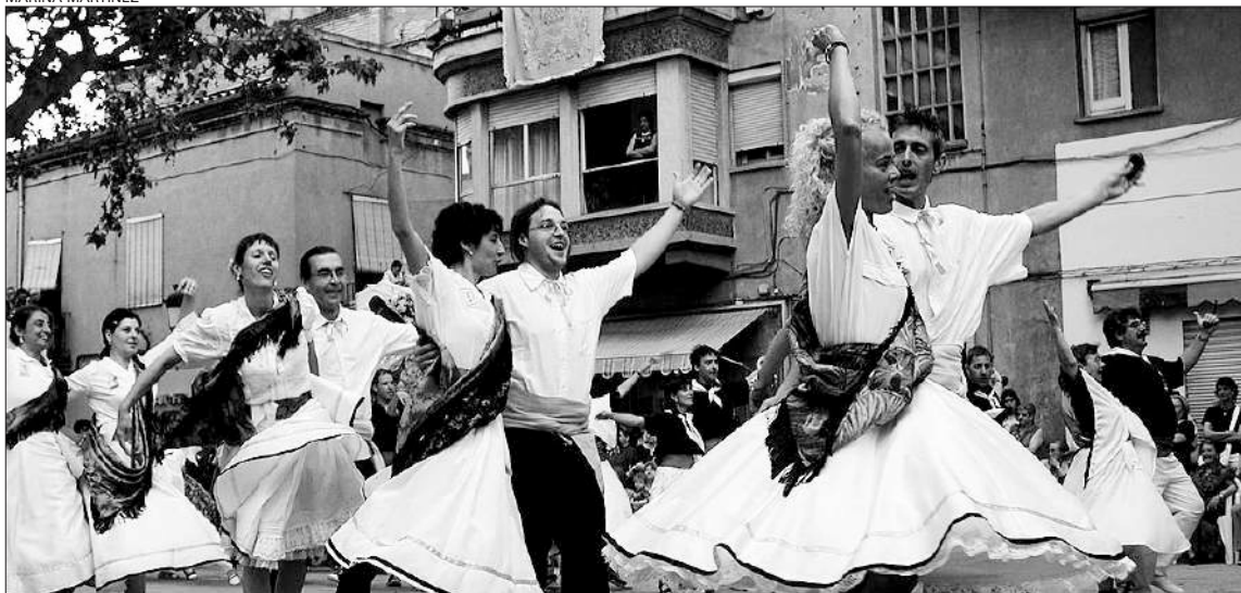
El ball de gitanes és una de les tradicions folklòriques més arrelades a Sant Vicenç