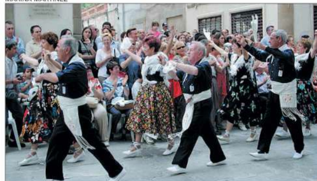
Una de les colles de balladors fent el galop