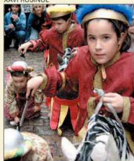
Patum de la Pietat, ahir