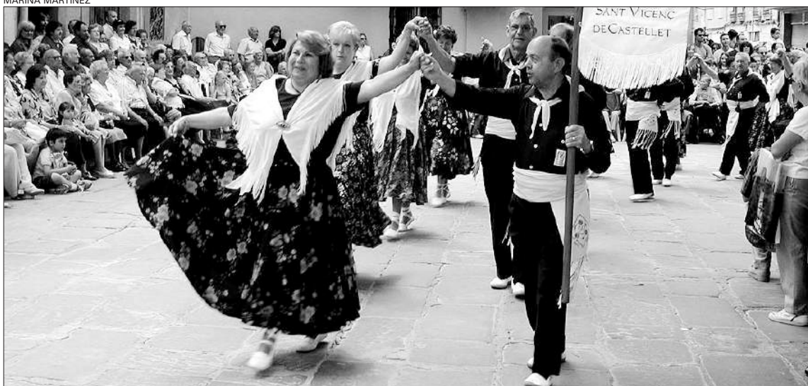
Un total de 180 participants, repartits en 11 colles, van prendre part en l'acte