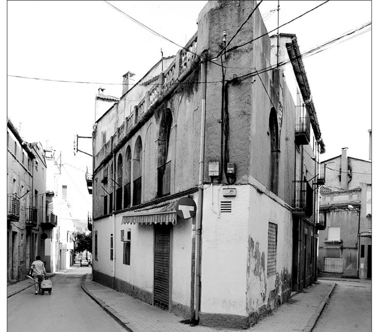
Façana de la casa que forma una illa triangular al centre de Sant Vicenç

gada s'hagi fet el desallotjament de les persones que ocupen la casa, es procedirà a tapiar-ne les entrades per tal de procedir a l'enderroc a l'inici de la tardor. El solar resultant, d'entre 250 i 300 metres quadrats, donarà lloc a una plaça.