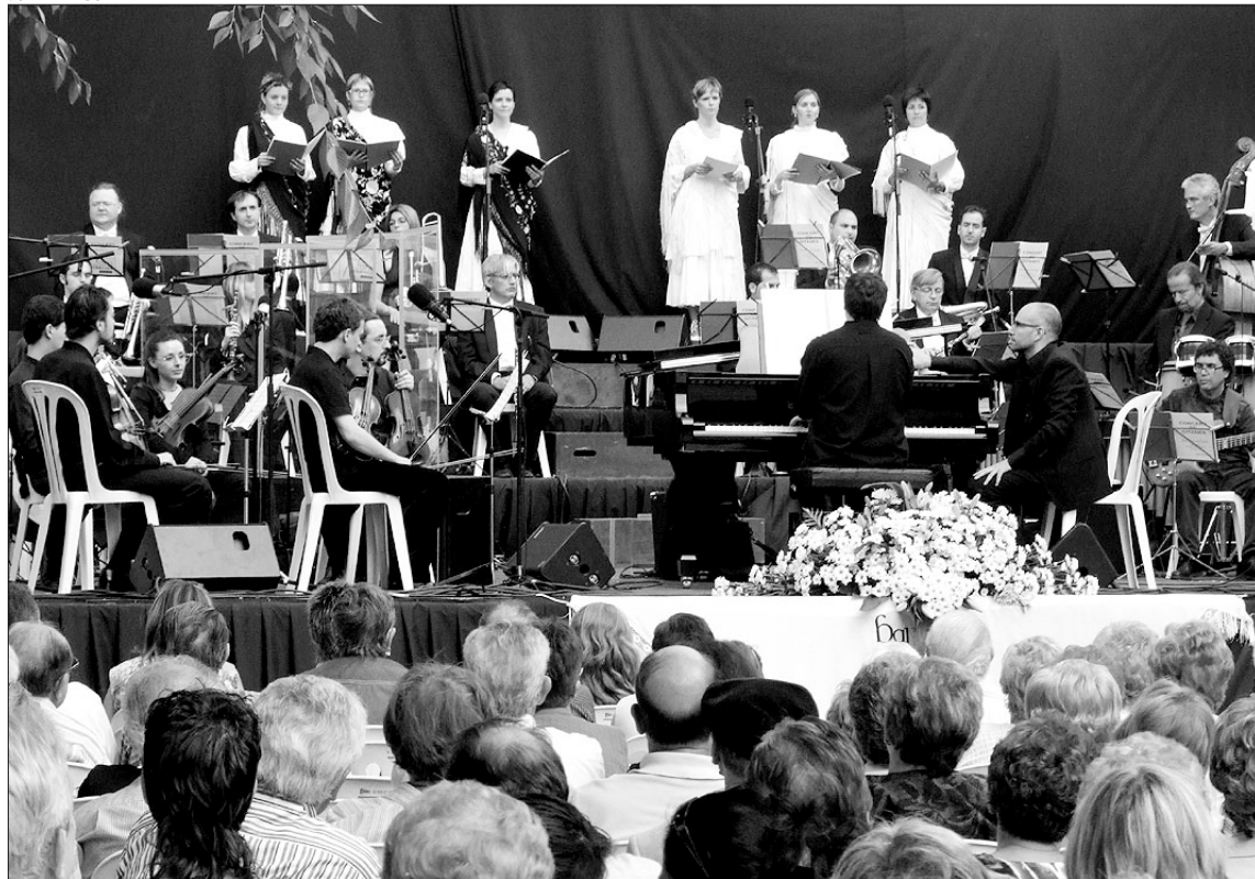
Mig miler de persones es van aplegar a la plaça Clavé per escoltar el concert de cloenda del centenari

sistents, que van poder escoltar la fusió de la música amb la part vocal. L'interès i la redescoberta rau en el fet que el ball de gitanes no té lletra, però se n'han pogut repescar alguns fragments, ja que alguns balladors hi posaven lletra inventada per tal de recordar-lo. El concert va acabar amb forts aplaudiments i amb el públic emocionat i dempeus reclamant un bis que no es va fer esperar.