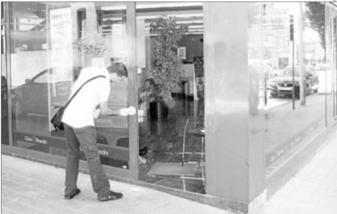
Un membre de la policia científica dels Mossos buscant empremtes a la porta d'entrada de l'oficina

Les càmeres de seguretat de l'oficina van poder enregistrar la seqüència dels fets, que es van succeir de forma ràpida. Segons els Mossos d'Esquadra, l'home va entrar amb aparent normalitat a l'interior de l'oficina. Anava amb la cara descoberta, tot i que portava una gorra i unes ulleres de sol que li servien per ocultar parcialment el rostre. Un cop al davant del taulell, la treballadora que hi havia al seu darrere li va demanar què volia. Aleshores, l'home es va aixecar la samarreta i, de sota, en va treure una pistola. Es desconeix si es tractava d'una arma de foc real o si era simulada. Fonts policials