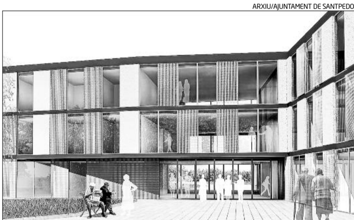
Imatge virtual de la nova residència d'avis de Can Jorba de Santpedor

El concurs públic per a construir la residència només va rebre una oferta, la de L'Onada. El fet que s'haguessin d'aportar 2,4 milions al projecte va fer que moltes de les que s'hi havien interessat es fessin enrere. L'Onada, però, és una empresa de gestió, per la qual cosa subcontractará l'obra a una constructora. L'Ajuntament ja l'hi ha fet arribar una llista amb cinc empreses del Bages classificades (reconegudes per portar grans contractes). Ara, L'Onada estudiarà les propostes.