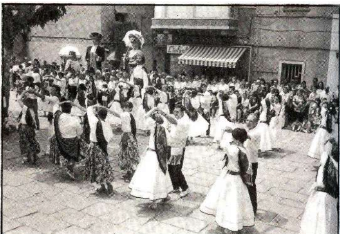
Diferents moments de les actuacions de les colles.