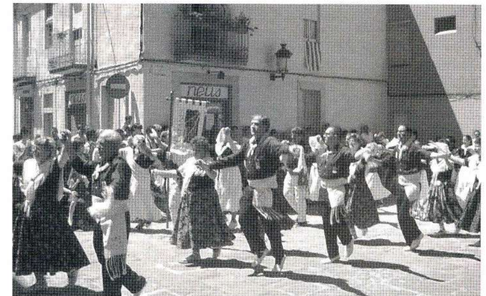
Un moment del Ball del Galop amb més de 180 balladors al mig de la Plaça de l'Ajuntament.

tip. La festa va començar al matí, a les 11, amb una missa a l'església. A la sortida d'aquesta, els integrants dels diferents grups van anar en cercavila i acompanyats pels gegants i els grallers fins a la plaça de l'Ajuntament. L'onzena ballada popular de gitanes va començar precisament amb el ball dels gegants, els barons de Castellet,