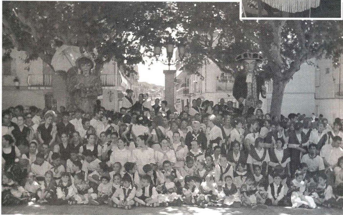
Foto de família de tots els participants al Ball de Gitanes d'aquest any 2002.