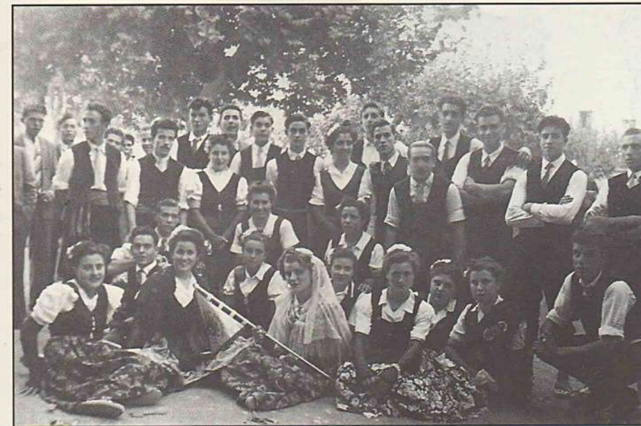
L'Esbart Dansaire Santvicentí entre l'any 1948 i 1953.