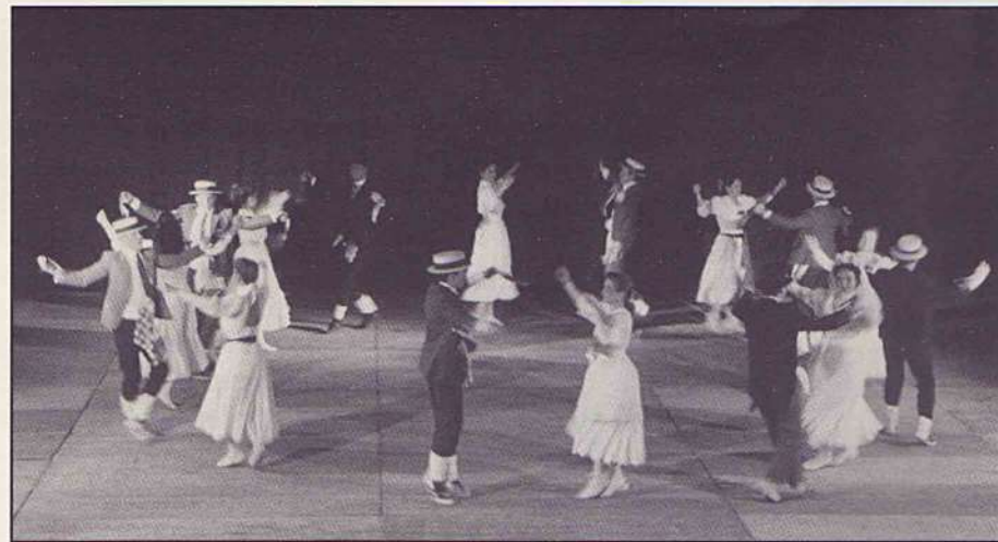
Les Gitanes de Sant Vicenç.

representacions, una en un local públic i una altra a la plaça de l'Ajuntament. L'Esbart va ballar gitanes entre els anys 1949 i 1953, amb actuacions memorables a Barcelona, davant de les fonts de Montjuïc, i a altres ciutats catalanes, com Manresa o Balaguer 20 . Després d'una llarga etapa d'inactivitat, l'Esbart es va reconstituir l'any 1981.