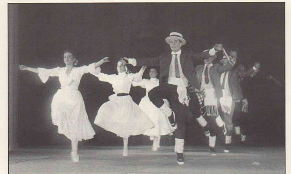
L'Esbart Dansaire Santvicentí al Teatre de la Passió d'Olesa, 1992.

Montserrat, però sobta que no hi aparegui cap referència a les gitanes.