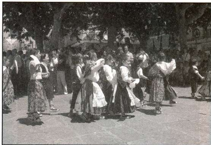
El més petits entrant a la plaça