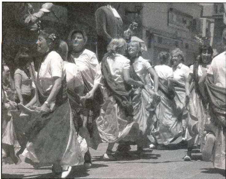
Colla balladora en un moment del ball