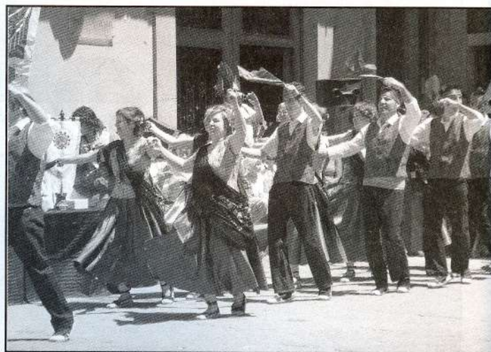
Galop d'entrada