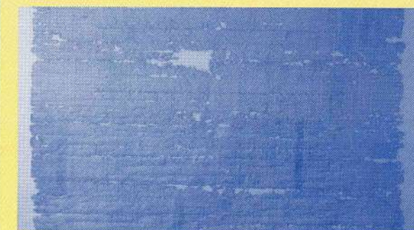
(mostra de l'original de la butlla papal)

L'Arxiu Municipal de Sant Vicenç de Castellet treballa aquestes setmanes en la laboriosa transcripció del document que certifica els primers mil anys d'història documentada al municipi. Es tracta d'una butlla papal que data del mes de maig del 1001, en la qual el Papa Silvestre II ratifica la concessió dels béns i possessions del castell i terme de Castellet al Bisbe Sal·la de la Seu d'Urgell, i els seus successors.